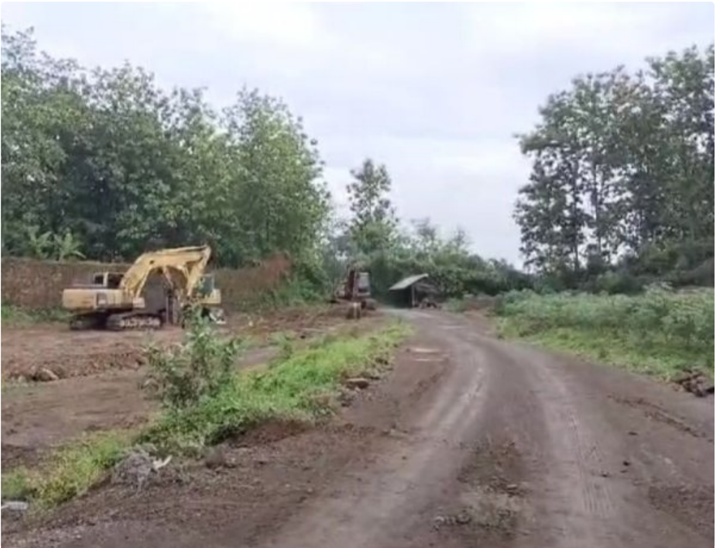
Foto: Tambang galian C di Desa Sumbermulyo, Kecamatan Tlogowungu, Kabupaten Pati, Jawa Tengah.

PATI - Cabang Dinas ESDM Wilayah Kendeng Muria kembali menjadi sorotan. Tambang galian C di Desa Sumbermulyo, Kecamatan Tlogowungu, diduga beroperasi tanpa izin selama hampir lima tahun. Ironisnya, aktivitas ini